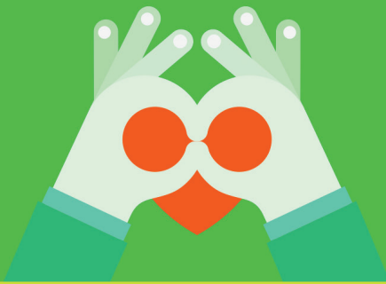
Illustration: Kang Chen, Titel des Werte-Index 2016 (Copyright frei)