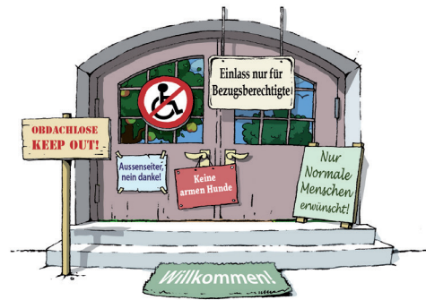
Illustration: Stefan Eiling (Copyright)