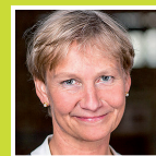
Kirsten Fehrs, Bischofin der Nordkirche im Sprengel Hamburg und Lübeck